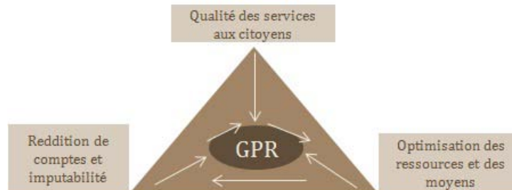
Figure 1 : Les axes fondant une gestion par résultats

La gestion par résultats (GPR), ou la gestion axée sur les résultats, est un cadre de gestion de la performance publique articulé autour de trois liens logiques établis entre la qualité des services aux citoyens, l'optimisation des ressources et des moyens disponibles et l'imputabilité des gestionnaires publics.